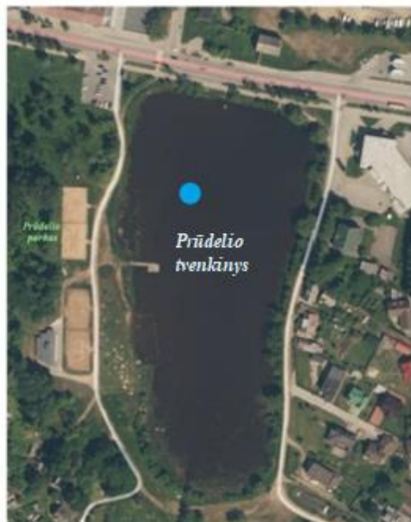
1 pav. Ledo storio ir ištirpusio deguonies koncentracijos matavimų vietos Šiaulių miesto paviršiniuose vandens telkiniuose 2024 m.