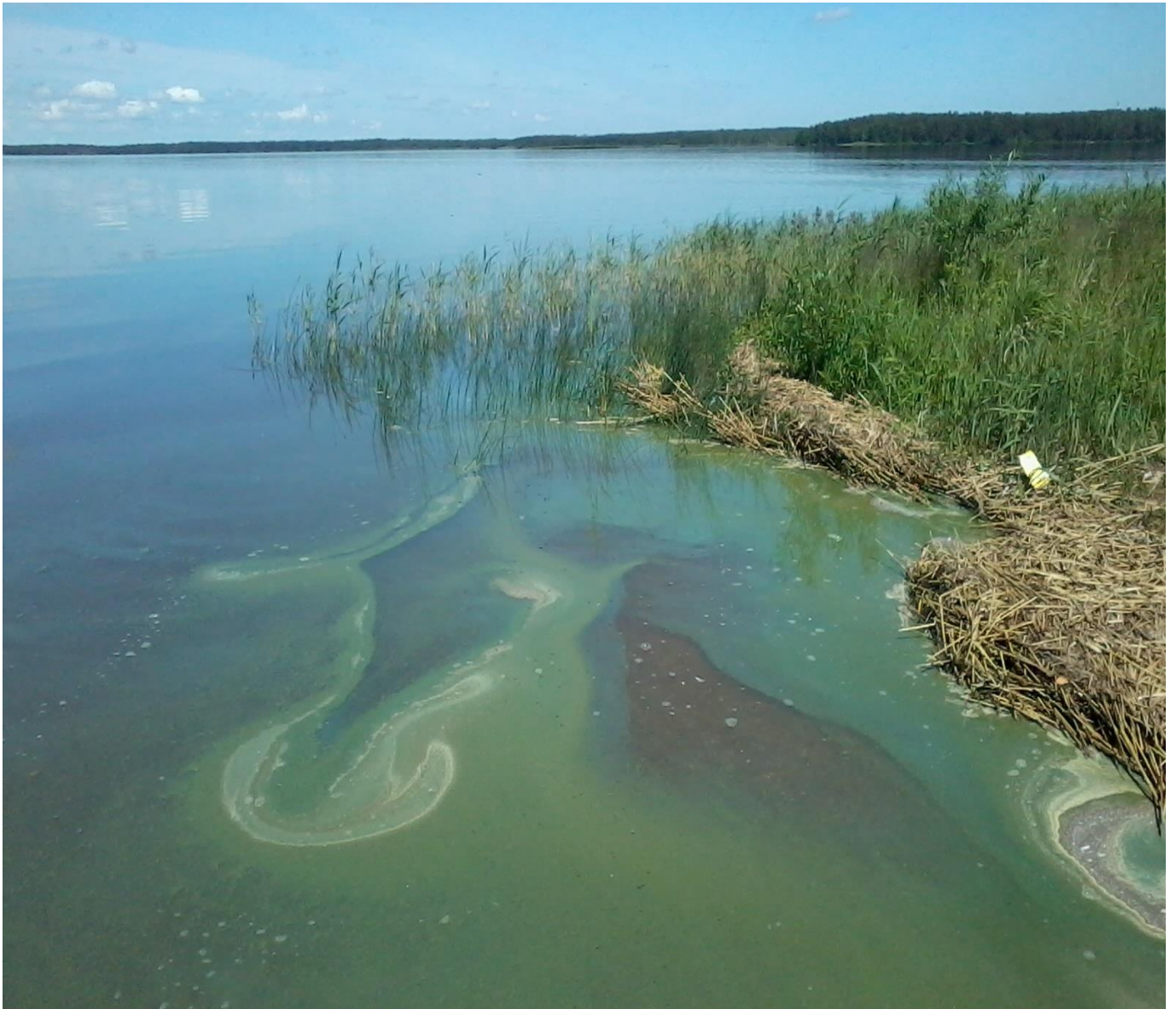
2 pav. Dumблиų sąnašos rytinėje Rėkyvos ežero pakrantėje ties Bačiūnų maudykla 2017-06-16 d. 13 val.