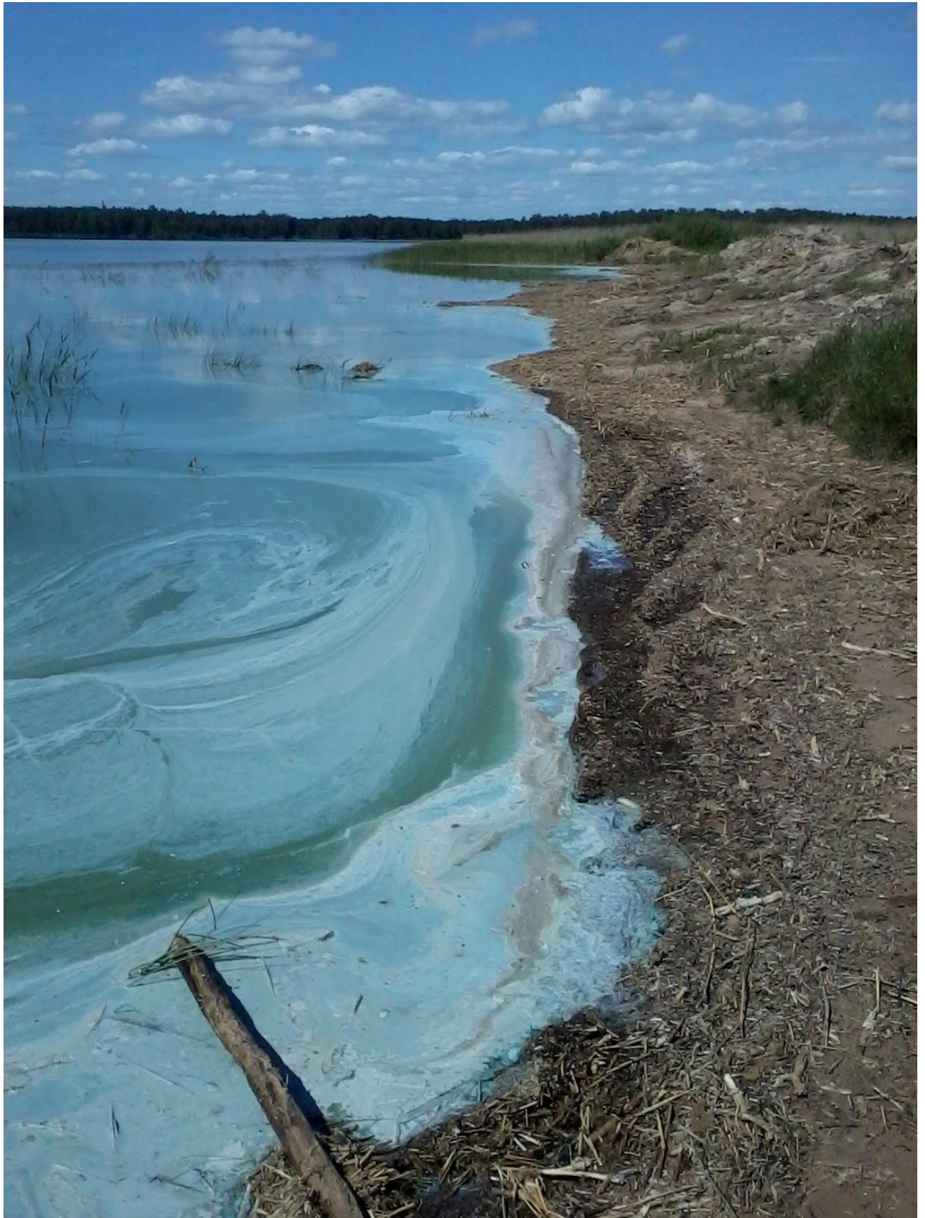
3 pav. Dumblių sąnašos rytinėje (V1) Rėkyvos ežero pakrantėje 2016-06-13d. 15 val.